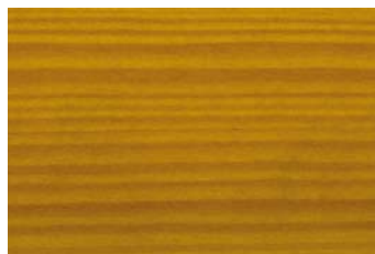
Eiche 005 / Oak 005 G: Eiche 005/P: Oak 005 E: Eiche 005/F: Oak 005