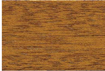
Eiche 005 / Oak 005 G: Eiche 005/P: Oak 005 E: Eiche 005/F: Oak 005