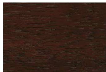
Palisander 013 / Rosewood 013 G: Palisander 013/P: Rosewood 013 E: Palisander 013/F: Rosewood 013

»The unspoilt nature of colour is a dreamlike sound, is light turned into music.«