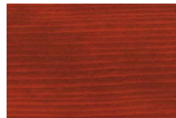
Mahagoni 010 / Mahagony 010 G: Mahagoni 010/P: Mahagony 010 E: Mahagoni 010/F: Mahagony 010