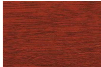
Mahagoni 010 / Mahagony 010 G: Mahagoni 010/P: Mahagony 010 E: Mahagoni 010/F: Mahagony 010