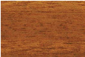
Altkiefer 002 / Pine old 002 G: Goldteak 008/P: Goldteak 008 E: Kiefer 004/F: Pine 004