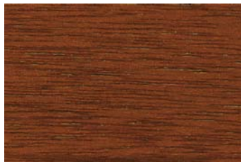
Eiche-hell 006 / Light oak 006 G: Eiche-hell 006/P: Light oak 006 E: Eiche-hell 006/F: Light oak 006