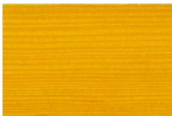
Kiefer 004 / Pine 004 G: Kiefer 004/P: Pine 004 E: Kiefer 004/F: Pine 004