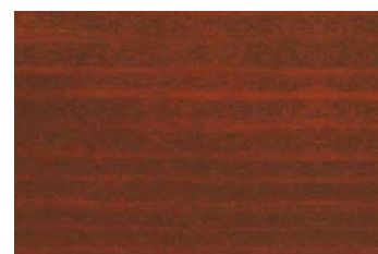
Antikmahagoni 018 / Mahagony antique 018 G: Palisander 013/P: Rosewood 013 E: Mahagoni 010/F: Mahagony 010