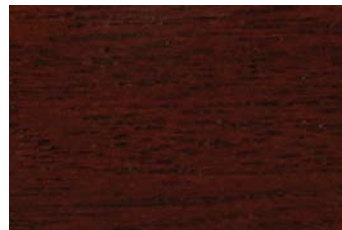
Antikmahagoni 018 / Mahagony antique 018 G: Palisander 013/P: Rosewood 013 E: Mahagoni 010/F: Mahagony 010