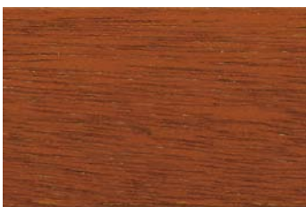
Kastanie 009 / Chestnut 009 G: Kastanie 009/P: Chestnut 009 E: Kastanie 009/F: Chestnut 009