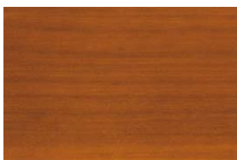
Kastanie 009 / Chestnut 009 G: Kastanie 009/P: Chestnut 009 E: Kastanie 009/F: Chestnut 009