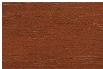
Teak 011 / Teak 011 G: Teak 011/P: Teak 011 E: Teak 011/F: Teak 011