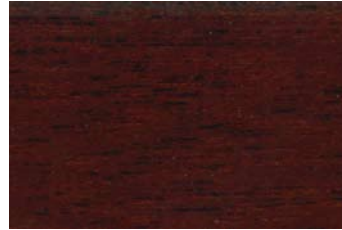
Walnuss 019 / American Walnut 019 G: Palisander 013/P: Rosewood 013 E: Teak 011/F: Teak 011