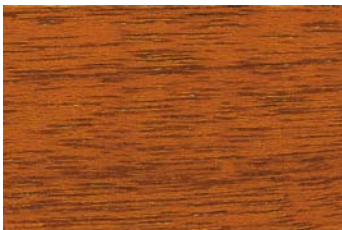
Goldteak 008 / Goldteak 008 G: Goldteak 008/P: Goldteak 008 E: Goldteak 008/F: Goldteak 008