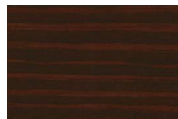
Palisander 013 / Rosewood 013 G: Palisander 013/P: Rosewood 013 E: Palisander 013/F: Rosewood 013