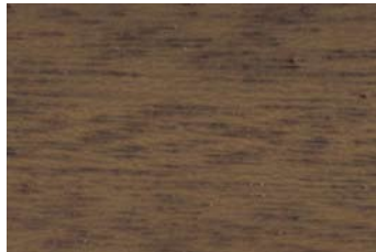
Rotbuche 023 / Common beech 023 G: Kastanie T2 016/P: Chestnut T2 016 E: Ahorn 001/F: Pine 001