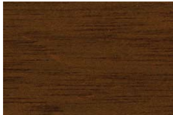
Esche 003 / Ash 003 G: Eiche 005/P: Oak 005 E: Eiche-hell 006/F: Light oak 006