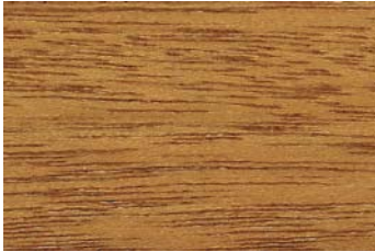
Ahorn 001 / Maple 001 G: Kiefer 004/P: Pine 004 E: Ahorn 001/F: Maple 001