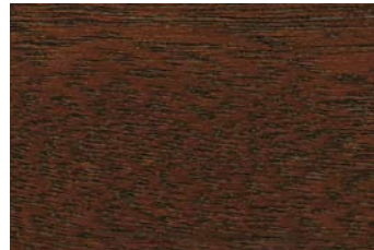
Nussbaum 012 / Walnut 012 G: Nussbaum 012/P: Walnut 012 E: Nussbaum 012/F: Walnut 012