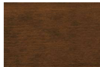
Nussbaum 012 / Walnut 012 G: Nussbaum 012/P: Walnut 012 E: Nussbaum 012/F: Walnut 012

»Das urtümliche Wesen der Farbe ist ein traumhaftes Klingen, ist Musik gewor- denes Licht.«